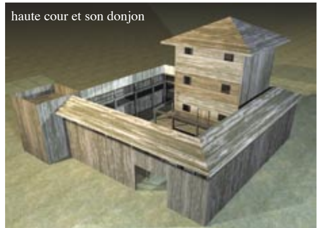
haute cour et son donjon

Venez voir les fortifications du boisé de belle rivière, sur le site de l'écotone, pour en savoir plus.